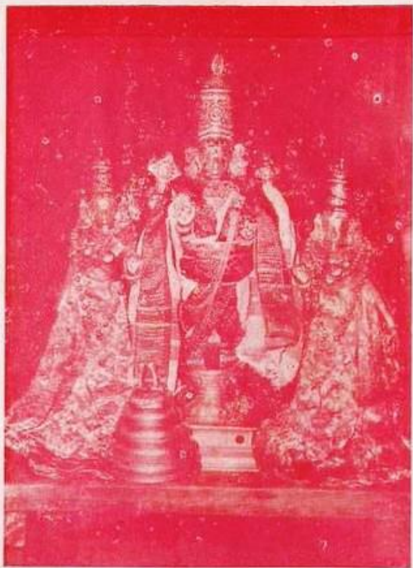
சேலிங்கபுரம் தக்காளர் (உ.தீலவர்)