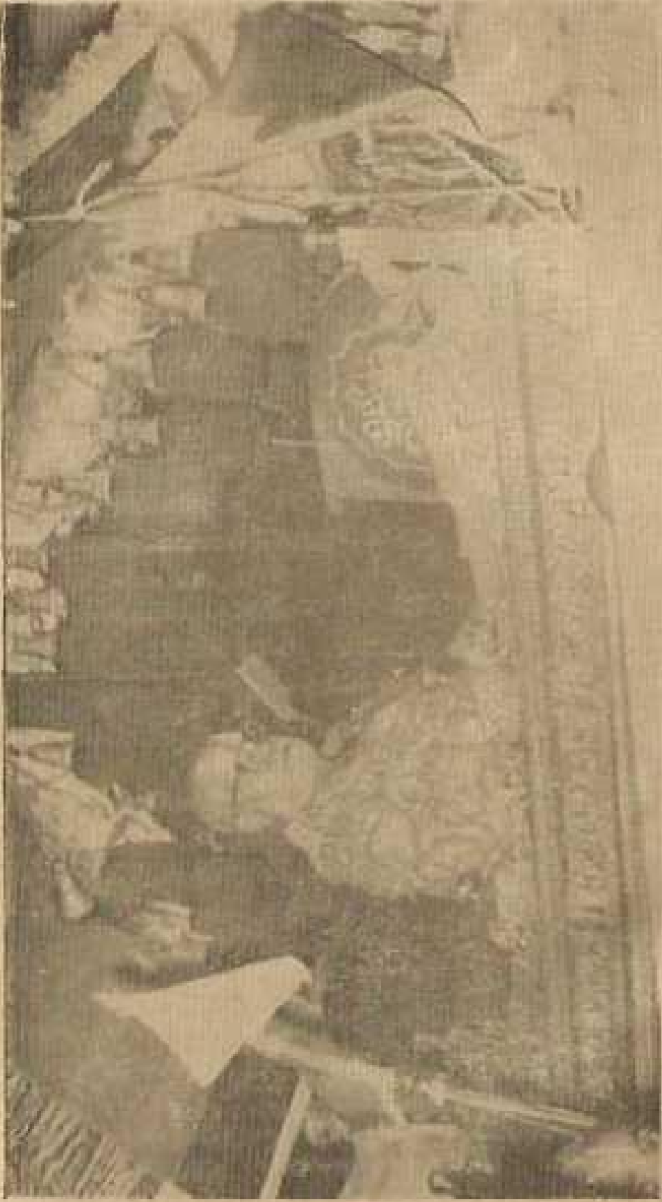
தங்கப் பல்க்கில் ஸ்தம்பர்ஸ்வாமியின் பட்டணப்ரவேசம்