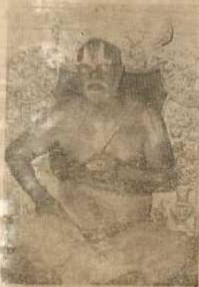
ஸ்ரீமத் பரமஹம்ஸ, வானமாமலைமடம் 38-வது பட்டம் ஸ்ரீ சடகோப ராமானுஜ ஜீயர் ஸ்வாமி