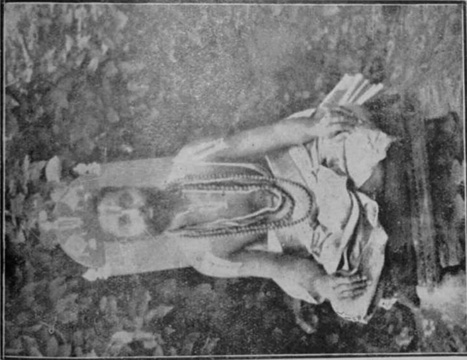
பிரயாகை வேணிமாதவ மந்திராதீச

(திருநாராயணபுரம் அக்காரககனி ஸ்வாமி திருவடி)